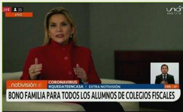
President Añez kondigt hulpmaatregelen af op de televisie.

De impact van de genomen maatregelen is dus niet te overzien. Ook omdat er geen statistieken worden bijgehouden van het aantal huishoudens waar de schulden zich opstapelen, die geen eten meer kunnen kopen, die hun geneesmiddelen niet meer kunnen aanschaffen bij chronische ziekte, waar er sprake is van geweld of mishandeling.