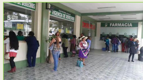
Een staatsziekenhuis van de nationale ziekenkas